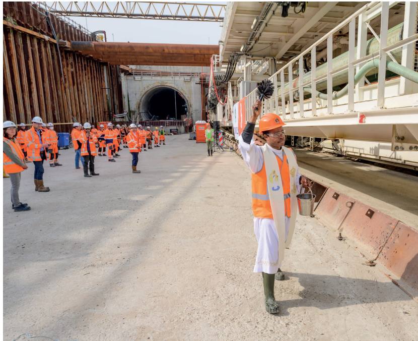
Start aanleg Rijnlandroute

Holland Rijnland is een centraal gelegen regio en wordt doorkruist door enkele belangrijke noord-zuidverbindingen, zoals de A4 en het ov-knooppunt Leiden, waar de Oude Lijn (spoorverbinding Haarlem-Dordrecht) samenkomt met de rechtstreekse verbinding naar Schiphol.